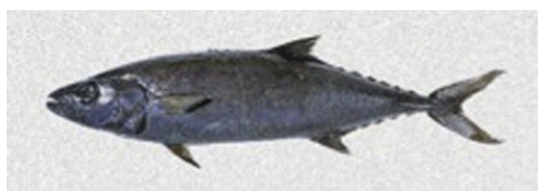
Figura 2 Scolar fish.

El contenido de aceite en la carne del R. pretiosus y del L. flavobrunneum oscila entre el 18 y el 21%, con más del 90% de ésteres cerosos. Estos ésteres permanecen intactos incluso después de ser expuestos al calor. Por lo tanto, el cuadro clínico se puede presentar tras la ingesta en forma cruda o cocida inadecuadamente. Existen algunas medidas