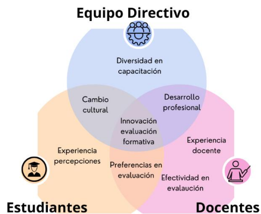
Figura 1. Convergencias y divergencias entre equipo directivo, docentes y estudiantes.