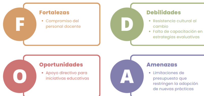
Figura 2. Análisis de fortalezas, oportunidades, debilidades y amenazas vinculado al diagnóstico del problema.