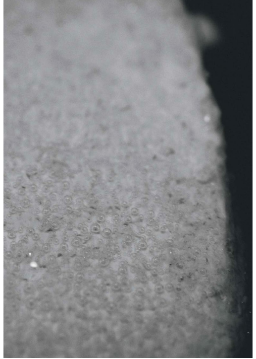
Fig. 6 y 7. Biocerámicas barnizadas, proyecto de Célian Le Bolloch, parte de su tesis de maestría.