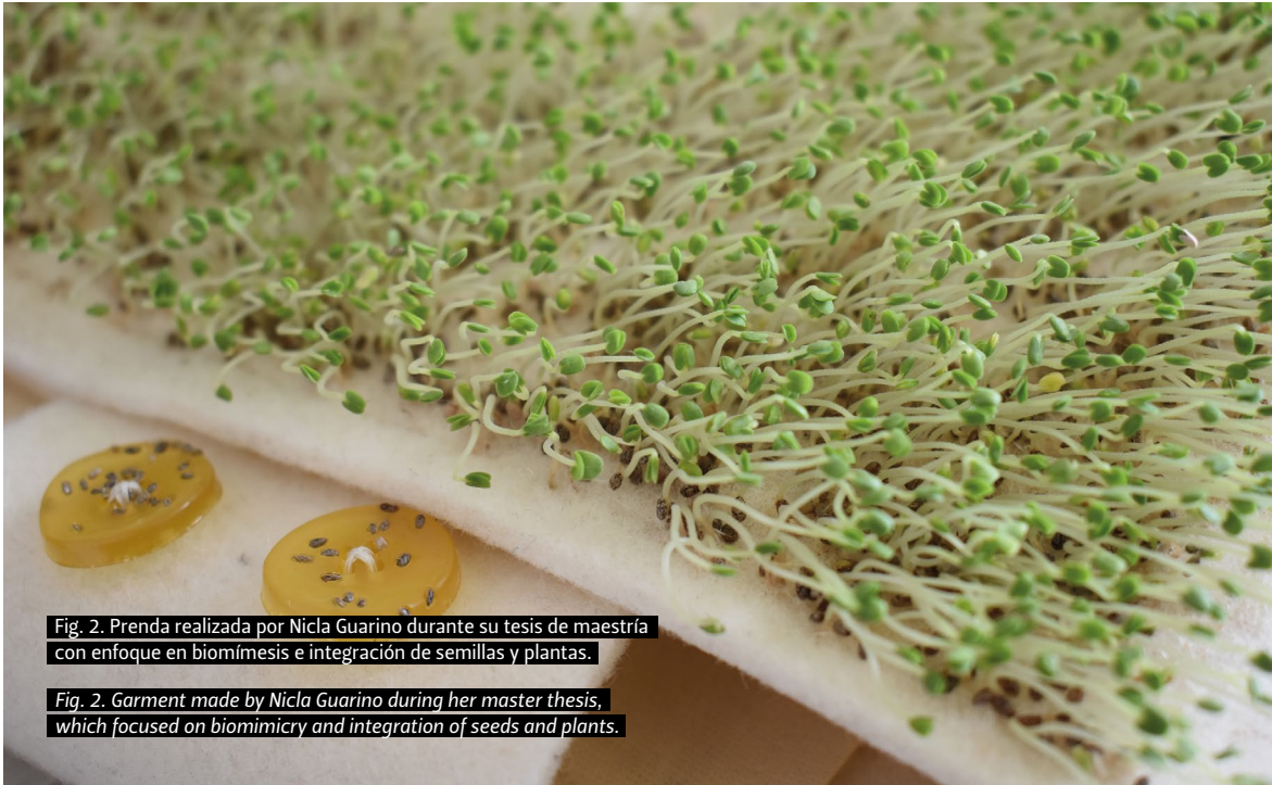
Fig. 2. Prenda realizada por Nicla Guarino durante su tesis de maestría con enfoque en biomimesis e integración de semillas y plantas.