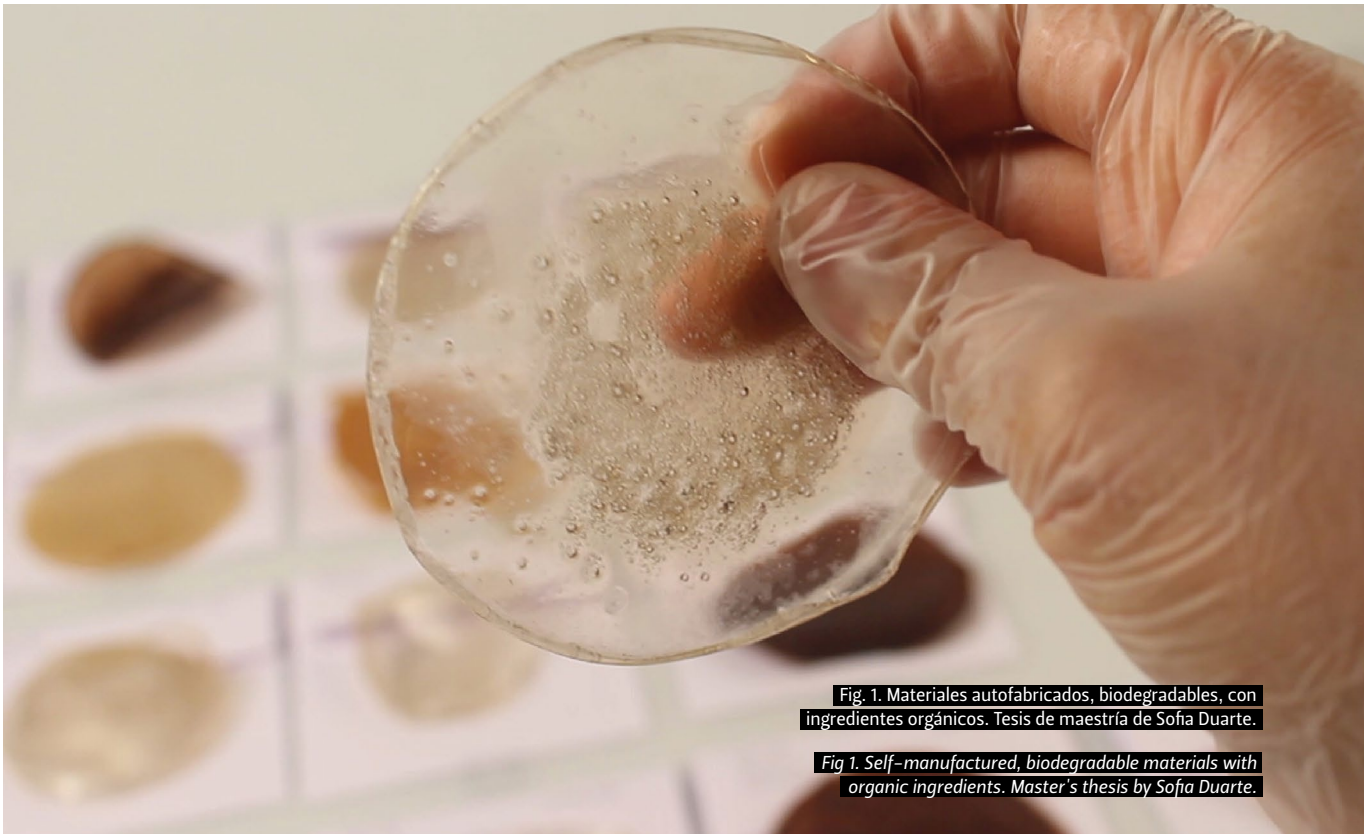
Fig 1. Materiales autofabricados, biodegradables, con ingredientes orgánicos. Tesis de maestría de Sofía Duarte.