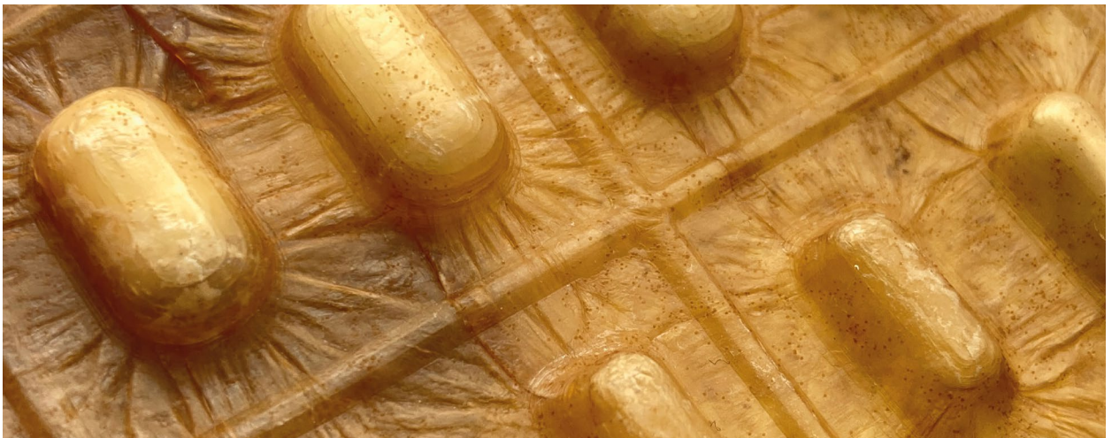
Fig. 4 y 5. Biotinkering with KCB, Samuele Fontana's project for his master's thesis.