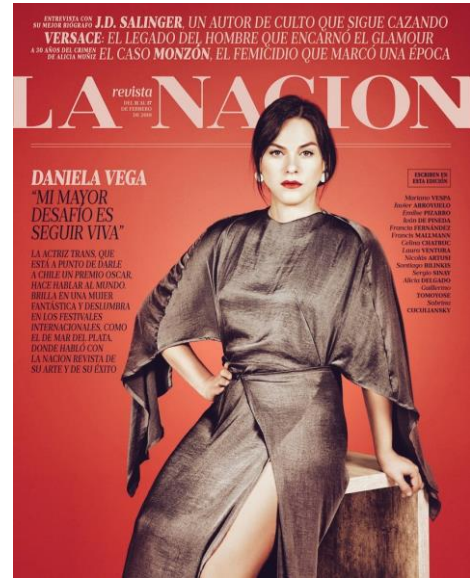
Imagen 2: Daniela Vega en la portada de la revista “La Nación”, 9 de febrero de 2018.