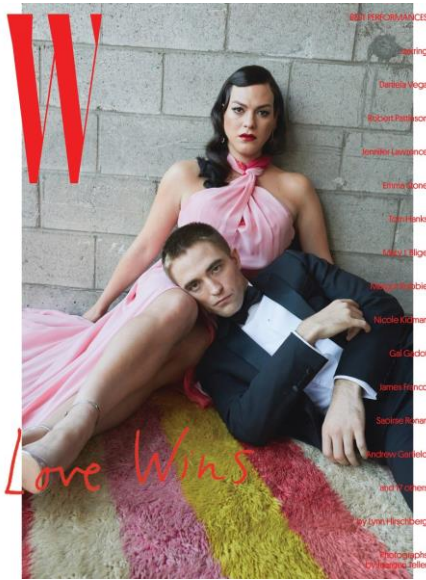
Imagen 1: Daniela Vega junto al actor de Hollywood, Robert Pattinson, para la revista “W”, 4 de enero de 2018