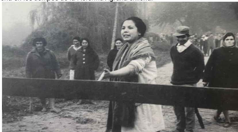
Figura 1: Mujer rural chilena en los tiempos de la Reforma Agraria chilena.