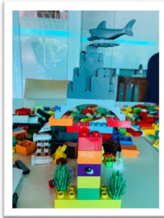
Dónde me encuentro