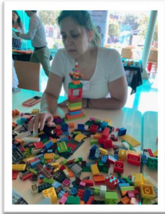
Abrir la mente