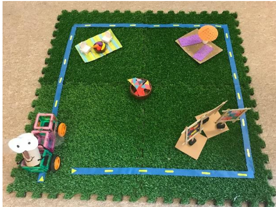
Figura n.1: Prototipo utilizado para Procedimiento de testeo

Si el alumno presenta dificultades para entender lo que debe hacer en cada estación, la educadora indica con su dedo el material del canasto que tiene que ubicar sobre el tablero.