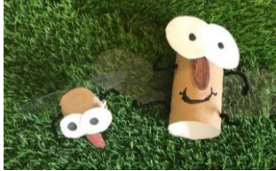
Figura n.3: Mosca nueva y mosca presentada al momento del testeo

Al ser una estrategia creada para alcanzar los objetivos a través de sus intereses, se autorizó a Pedro a cambiar ciertos materiales que se pensaron como motivantes para él, como lo fue el tren de magnetos.