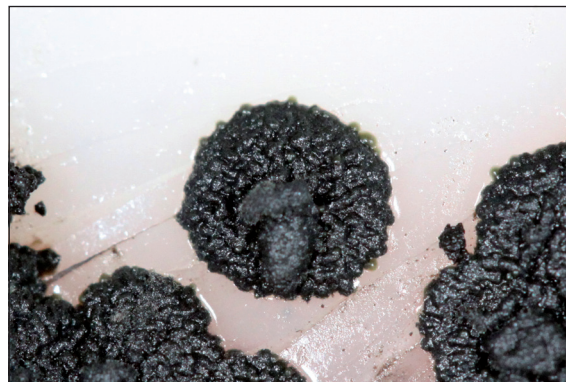
Figura 4. Cultivo. Colonias color negro grisáceo que en su superficie presentan pequeñas vellosidades aterciopeladas.

Se presenta como una infección asintomática, que compromete con mayor frecuencia palmas y plantas, pero también puede encontrarse en zonas cervicales y torácicas 22 . Es más común que sea una lesión única, unilateral, pero pueden presentarse también en ambas extremidades 8 . La presentación bilateral, como nuestro caso, es muy infrecuente, existiendo seis casos publicados en palmas 12,16,18 y sólo dos casos en la región plantar 11,16 .