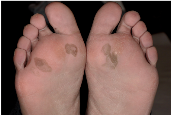
Figura 1. Fotografía clínica de ambas plantas. Se observan manchas de forma irregular, bordes definidos y coloración café, con tonos más oscuros en la periferia y zonas más claras al centro.