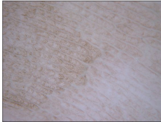
Figura 2. La dermatoscopia muestra múltiples hebras café claras coalescentes, formando una pseudo-red pigmentada. La pigmentación muestra un "patrón de dermatoglifos". (Dermatoscopia Hybrid, 10x).

negro grisáceo en anverso y reverso de la placa de agar Sabouraud, sin pigmento difusible. En su superficie presentaban pequeñas vellosidades aterciopeladas (Figura 4). Durante el transcurso de esta observación, desde una de estas colonias paralelamente se realizó un microcultivo (cultivo en lámina), donde se observaron hifas septadas dematiáceas y levaduras café de forma elíptica uni y bicelulares, con un septo bien diferenciado de color negro y conidiación anelídica visible. Los conidios inicialmente hialinos, luego se tornaron verde oliva o café. Con los hallazgos macroscópicos y microscópicos obtenidos se identificó la presencia de Hortaea werneckii . Además, sobre algunas colonias se realizaron pruebas fisiológicas de crecimiento con la finalidad de diferenciar la especie. Se demostró tolerancia en medios con NaCl 10%, asimilación de lactosa, nitrato y nitrito e inhibición de crecimiento a 37°C.