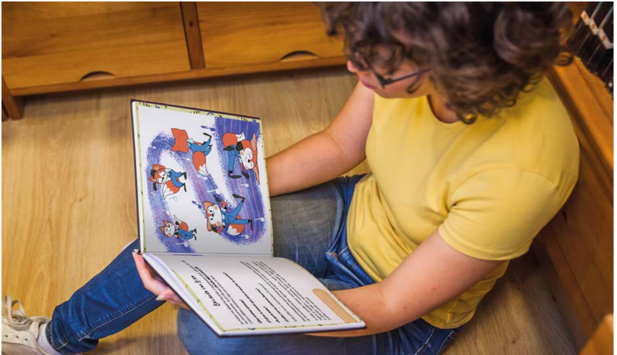
Fig. 2, 3 y 4 Rito es el personaje principal del cuento, un pequeño zorro que sufre trastorno de ansiedad. A través de sus aventuras, enseña a los niños a conocer y regular sus emociones. Figs. 2, 3 & 4 Rito, a little fox suffering from anxiety disorder, is the story's main character. Through his adventures, he teaches children to know and regulate their emotions.