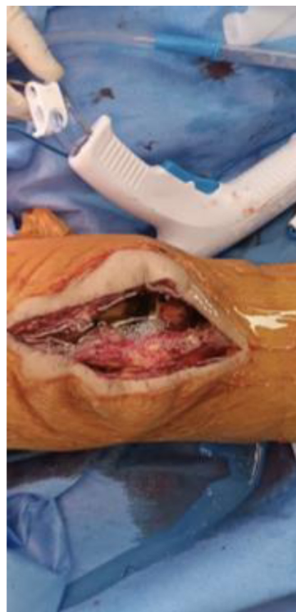
Figura 3 «Piscina» con solución antiséptica.

En el protocolo de Chung et al., durante la primera fase se realizaron cultivos y se retiraron todos los componentes modulares, los cuales fueron lavados y sumergidos en una solución antiséptica durante 3 a 5 minutos (fig. 3). Luego se llevó a cabo un prolijo procedimiento de irrigación y desbridamiento, incluyendo sinovectomía radical, se reimplantó el polietileno previamente sumergido en solución antiséptica y se introdujeron perlas de cemento con antibiótico en dosis elevadas (2-3 g de vancomicina, 3,6-4,8 g de tobramicina y 2 g de cefazolina; todas estas concentraciones están dadas por cada 40 gramos de cemento que se utilicen) en la articulación antes de su cierre (fig. 4), para después dejar la rodilla con una inmovilizador ortopédico.