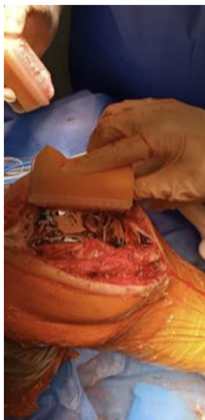
Figura 2 Escobillado profuso de las superficies articulares.

(50-70%). Las infecciones polimicrobianas y aquellas con gérmenes que forman biofilms suelen tener tasas de éxito más bajas. Factores como la rapidez en el diagnóstico, las comorbilidades del paciente y la formación de biofilms también influyen significativamente en el resultado del tratamiento.