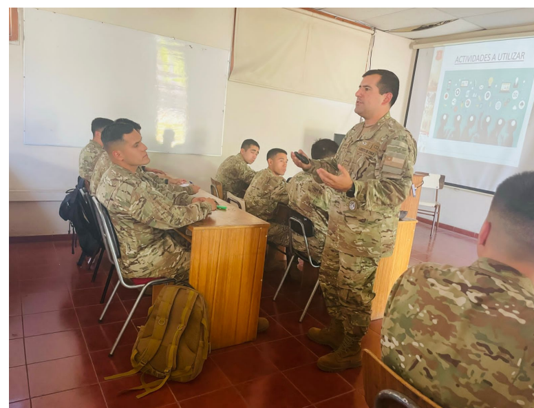
Socialización del Plan de Intervención de retroalimentación efectiva a los estudiantes.