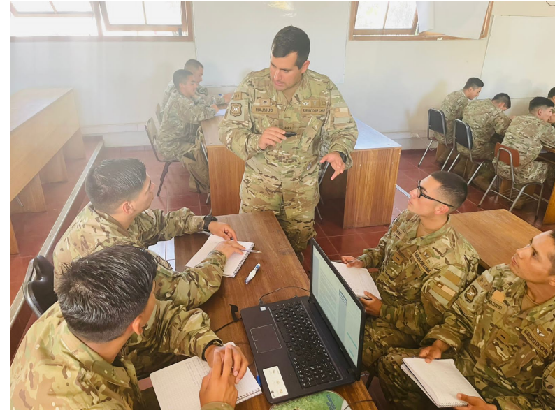
Implementación del Plan de Intervención de retroalimentación: Tácticas de Interacción verbal