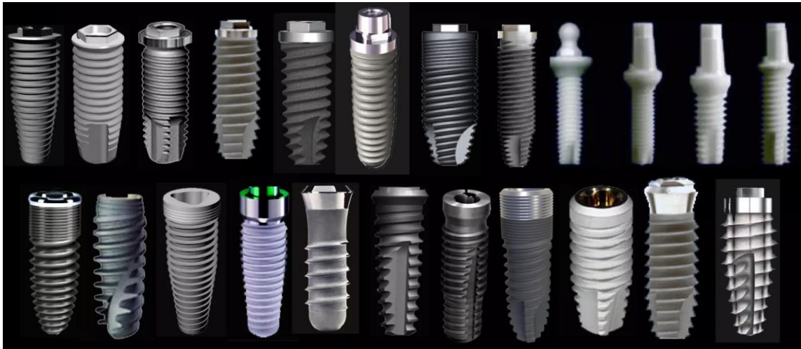
Figura 2: Esquema de diversos macrodiseños de sistemas de implantes.

hueso tipo IV, el implante con macrodiseño cónico alcanzó niveles más elevados de estabilidad primaria en comparación con los modelos cilíndricos.