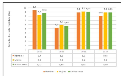
Figura 3: PEH (días) por EC, según sexo durante el período 2020-2023 en Chile.

El promedio de estadía hospitalaria durante el período fue de 8,04 días. El año con las estadías más prolongadas fue 2022, con un promedio de 9,03 días. En 2023 y 2020, los promedios fueron similares (8,82 y 8,72 días, respectivamente). La estadía más corta se registró en 2021, con un promedio de 5,58 días. (Figura 3).