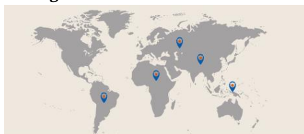
Figura 1. La ONU en el Mundo

Desde 1996, el Fondo Fiduciario de la ONU ha otorgado 198 millones a 609 iniciativas en 140 países y territorios, especialmente en Hispanoamérica, Asia, África y Oriente Medio.