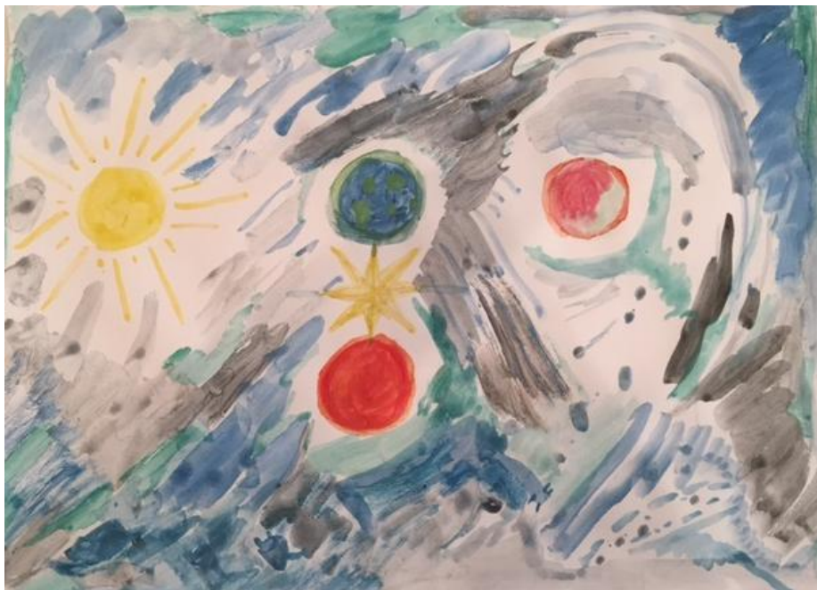
Figura 1. Primera sesión. Dibujo Libre: “Imagen de Los Planetas”.

Introduciendo en líneas generales y de manera de facilitar su posterior comprensión, se presentarán al lector las imágenes creadas. De esta forma, si bien a lo largo del análisis se profundizará en algunos detalles de las obras y se recurrirá nuevamente a las imágenes, es propicio presentarlas de manera de obtener una mirada más sistémica y global de las sesiones: