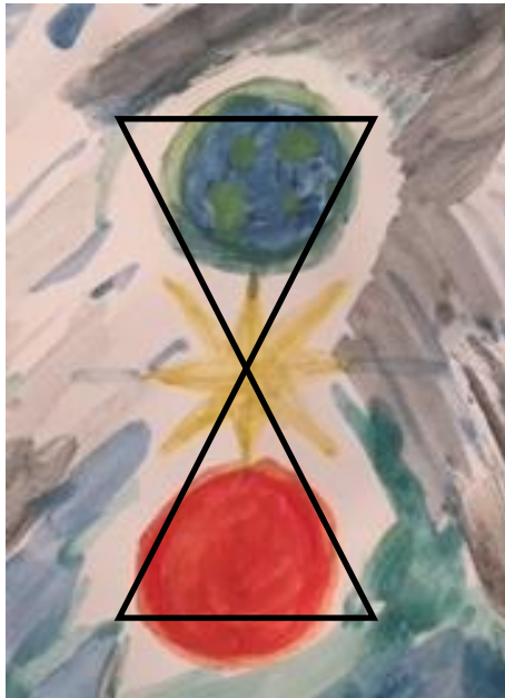
Figura 8. Detalle de la imagen, en la cual puede apreciarse el gesto de infinito y de la cruz, entre la tierra, Venus y la estrella.