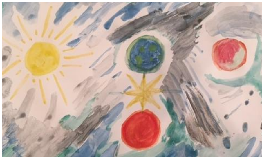
Figura 7. Detalle de la imagen de los planetas mostrando la composición cuaternaria y elemento de la estrella en múltiplos de cuatro.

Asimismo y tal como podemos observar en la imagen a continuación, es posible ver una estrella de ocho puntas, aludiendo también a múltiplos de cuatro y uniendo dos de dichos elementos circulares en el centro de la hoja, que son la tierra y Venus: