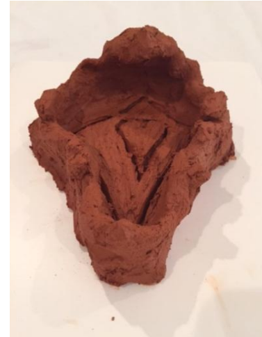
Figuras 3 y 4. Tercera sesión. Lectura de Mitos: “Figura de Greda”. Vista lateral y vista aérea.