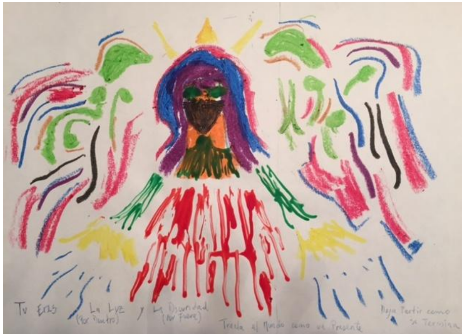
Figura 2. Segunda sesión. Actividad de Imaginería: “Imagen del Personaje”.