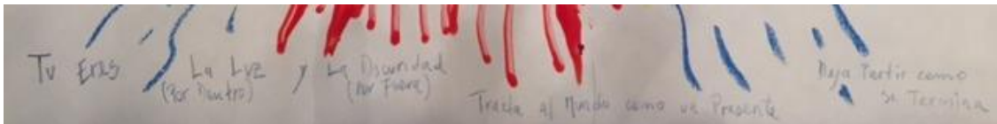
Figura 11. Detalle del mensaje en la imagen del personaje: “Tú Eres. La Luz (Por Dentro) y La Oscuridad (Por Fuera). Tráela al Mundo como un Presente. Deja Partir como se Termina”.

En la siguiente fotografía, revisaremos el mensaje con el objetivo de comprender de mejor manera el carácter dicotómico que posee, es decir, la totalidad y las polaridades que contiene: