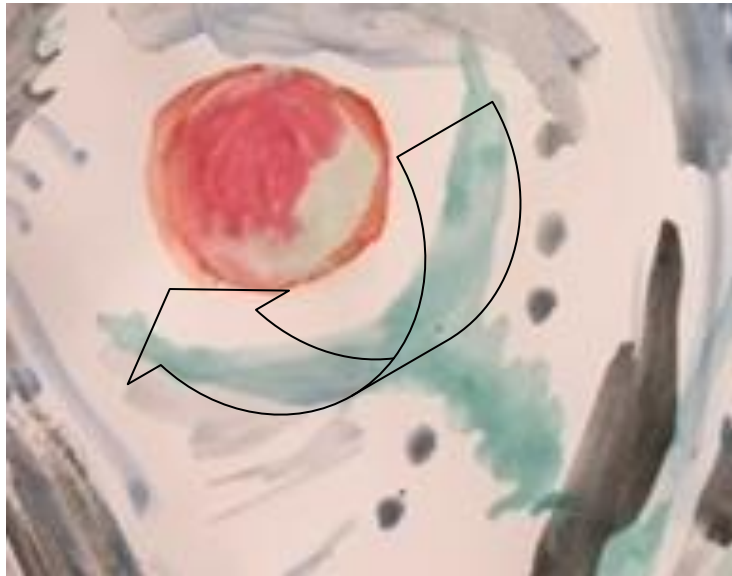
Figura 12. Detalle de la Imagen de los Planetas, mostrando con la flecha el gesto en color verde que, de acuerdo a lo señalado por el participante, “contiene” a la Luna.

alusión a lo materno en el relato de la primera imagen creada – La imagen de los planetas – en tanto logra asociar la Luna a cualidades femeninas y también a un gesto pictórico que veremos en la siguiente fotografía, en la que Tomás detalla cualidades maternas, que son relacionadas a la emocionalidad y a lo lunar: