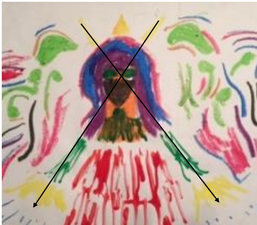
Figura 9. Detalle de la imagen del personaje (segunda sesión). Proyección en forma de cruz entre la corona y manos del personaje.

Podemos señalar que si bien no es explícitamente observable el símbolo del cuaternio en esta imagen del personaje, sí es posible percibirlo al realizar la proyección de una línea imaginaria entre los extremos de la corona y los rayos de las manos del personaje, formándose una figura en forma de cruz. Dicha representación podemos observarla a continuación en la siguiente fotografía: