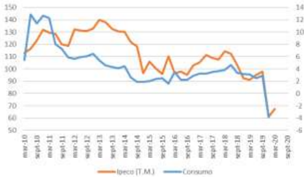
GRÁFICO 2 IPeCo y Crecimiento anual del consumo privado

T.M. = Trimestre móvil