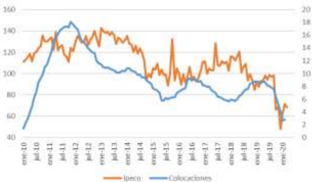
GRÁFICO 3 IPeCo y Crecimiento anual de las colocaciones de consumo