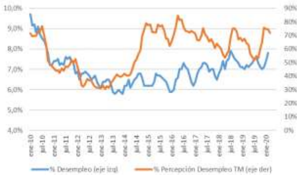
GRÁFICO 5 Desempleo y Percepción sobre desempleo actual