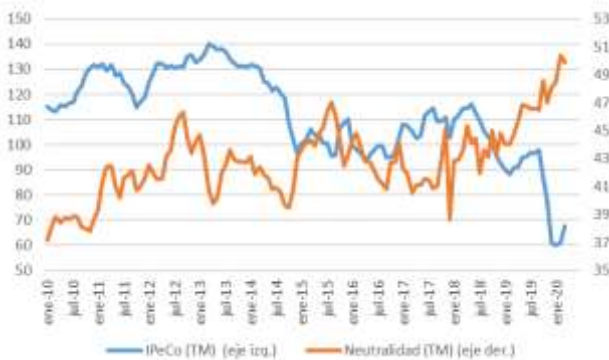
GRÁFICO 6 Neutralidad y Percepción de los Consumidores