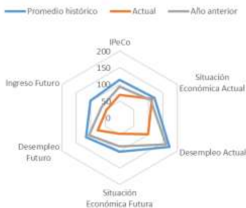
GRÁFICO 4 IPeCo y percepciones