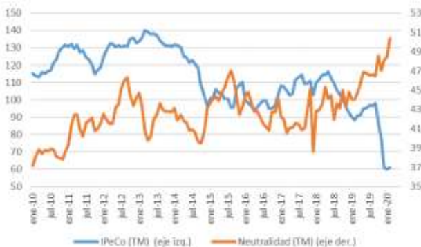
GRÁFICO 6 Neutralidad y Percepción de los Consumidores