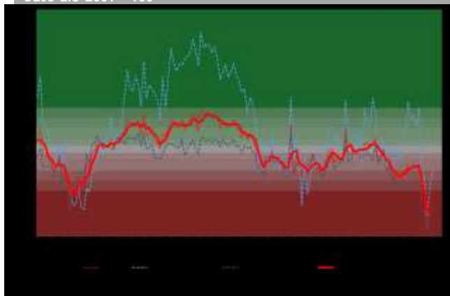
GRÁFICO 1 Índice de Percepción de Consumidores Base dic-2001 = 100

A nivel regional, los cambios en la confianza fueron mixtos. En la Región Metropolitana aumentó, pasando de extraordinariamente pesimista a pesimista, mientras que en la Región del Bío-Bío disminuyó de muy pesimista a extraordinariamente pesimista.