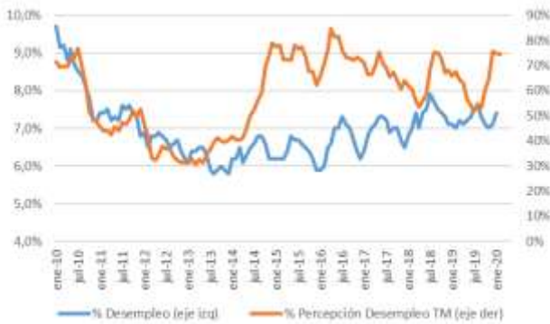
GRÁFICO 5 Desempleo y Percepción sobre desempleo actual