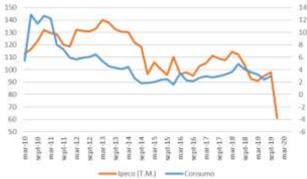
GRÁFICO 2 IPeCo y Crecimiento anual del consumo privado

T.M. = Trimestre móvil