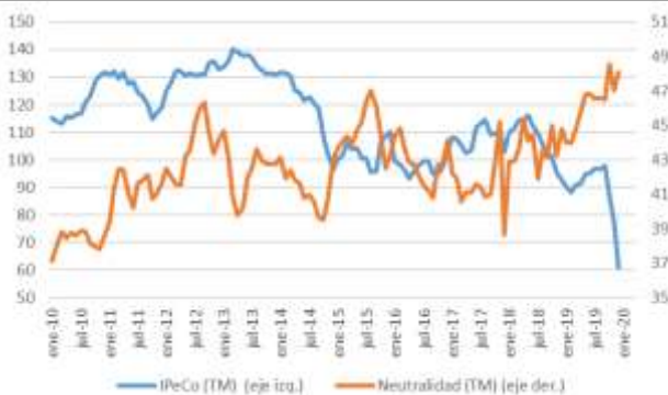
GRÁFICO 6 Neutralidad y Percepción de los Consumidores