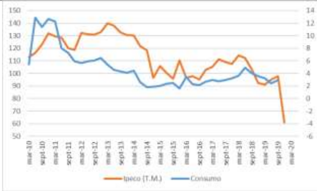
GRÁFICO 2 IpeCo y Crecimiento anual del consumo privado

T.M. = Trimestre móvil