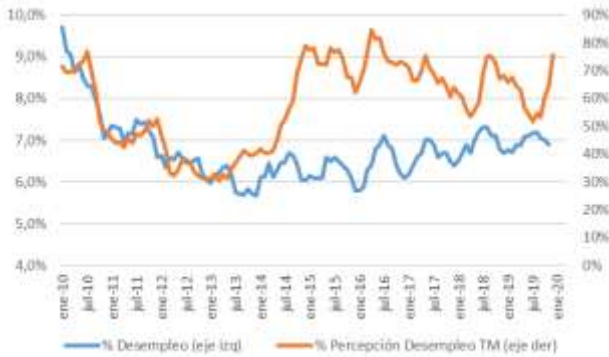
GRÁFICO 5 Desempleo y Percepción sobre desempleo actual