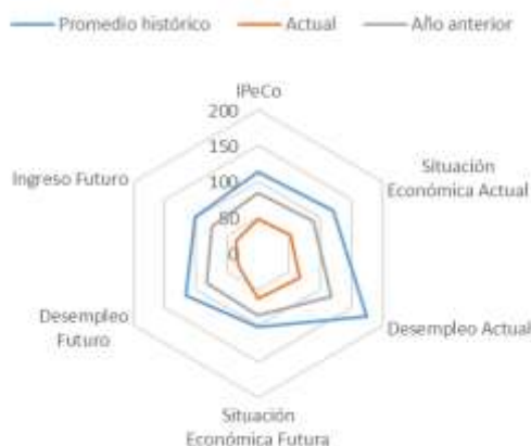
GRÁFICO 4 IPeCo y percepciones