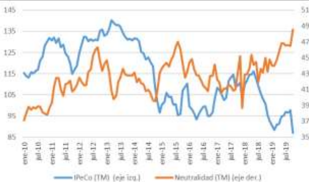
GRÁFICO 6 Neutralidad y Percepción de los Consumidores