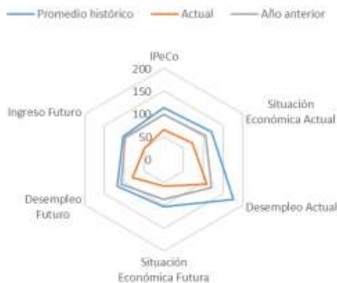
GRÁFICO 4 IPeCo y percepciones