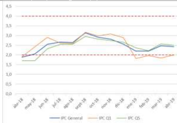
Gráfico 1 Variación anual IPC general y 20% de los hogares con menores y mayores ingresos (%).

El Q1 corresponde al 20% de hogares de más bajos ingresos, mientras que el Q5 corresponde al 20% de hogares con más altos ingresos.