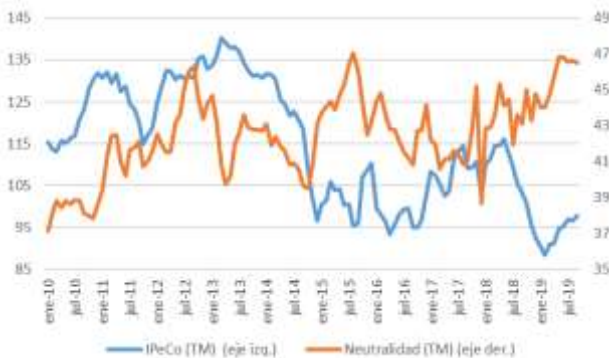
GRÁFICO 6 Neutralidad y Percepción de los Consumidores