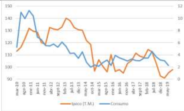
GRÁFICO 2 IPeCo y Crecimiento anual del consumo privado

T.M. = Trimestre móvil