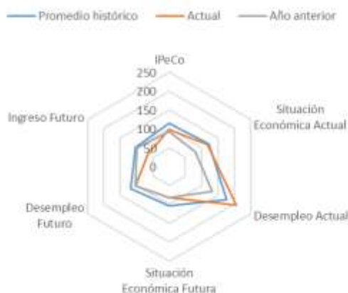
GRÁFICO 4 IPeCo y percepciones