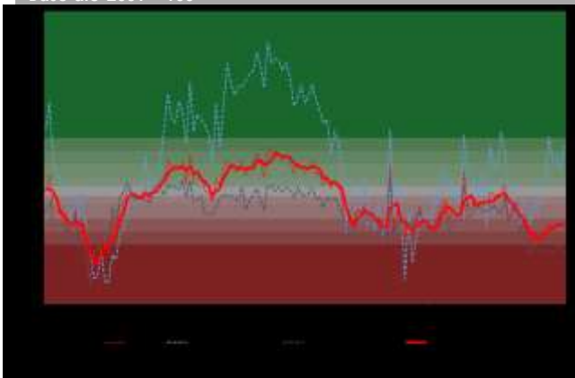
GRÁFICO 1 Índice de Percepción de Consumidores Base dic-2001 = 100

En los estratos socioeconómicos se observaron resultados mixtos. En el estrato ABC1 la confianza aumentó, aunque se mantuvo neutral. En el C2 disminuyó, sin embargo, se mantuvo muy pesimista. En el C3 disminuyó, no obstante, se mantuvo moderadamente pesimista. En el D aumentó, aunque se mantuvo levemente pesimista. En el estrato E avanzó, pero se mantuvo levemente pesimista.