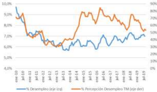
GRÁFICO 5 Desempleo y Percepción sobre desempleo actual