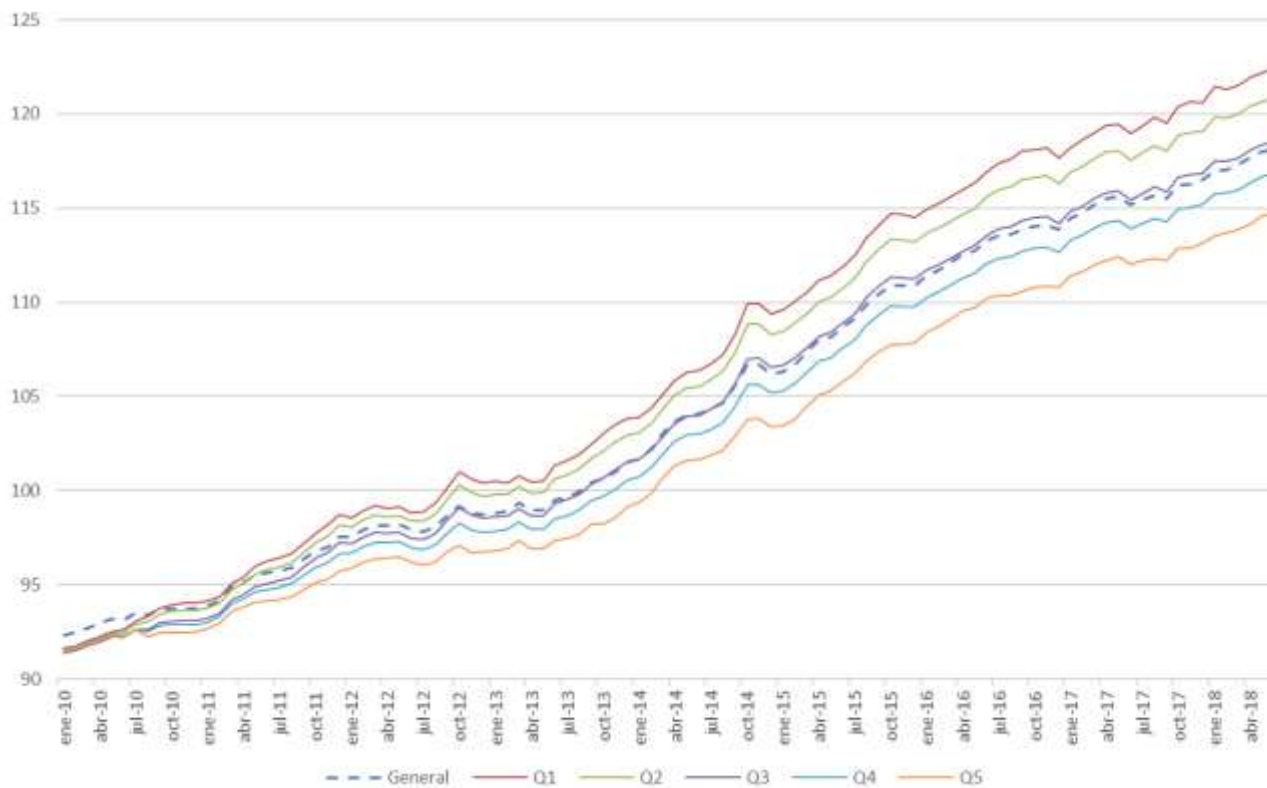
Gráfico 4 Índice de Precios al Consumidor por grupos de ingreso

El Q1 corresponde al 20% de hogares de más bajos ingresos, mientras que el Q5 corresponde al 20% de hogares con más altos ingresos. Fuente: elaboración propia en base a datos del INE.