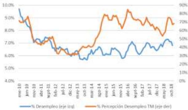
GRÁFICO 5 Desempleo y Percepción sobre desempleo actual