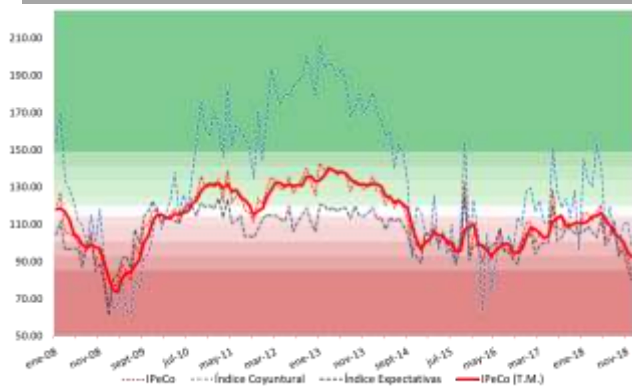
GRÁFICO 1 Índice de Percepción de Consumidores Base dic-2001 = 100