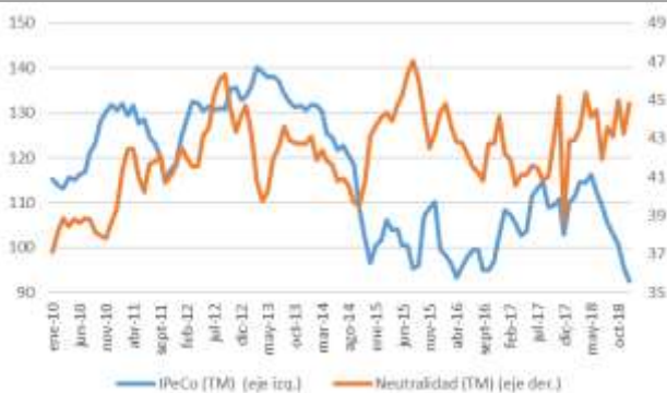
GRÁFICO 6 Neutralidad y Percepción de los Consumidores

Fuente: CEEN UDD en base a encuestas en Mall Plaza