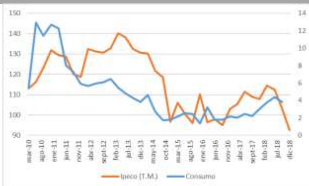
GRÁFICO 2 IPeCo y Crecimiento anual del consumo privado