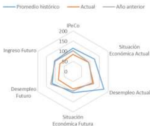
GRÁFICO 4 IPeCo y percepciones