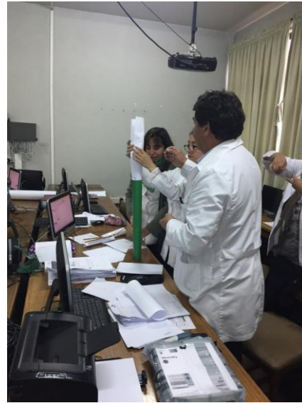
Taller de trabajo colaborativo