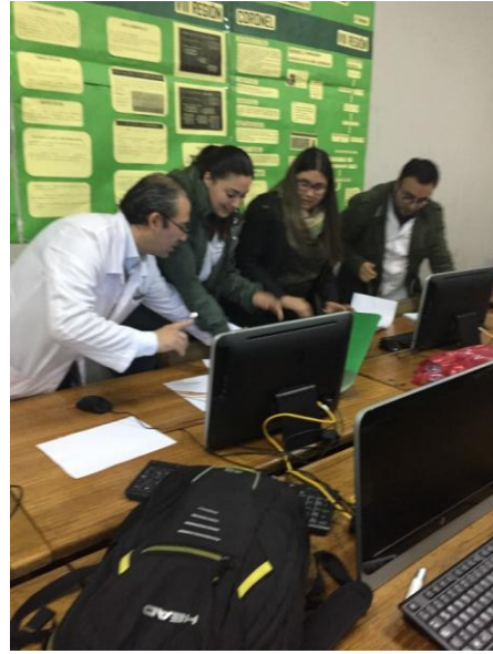
Taller de trabajo colaborativo