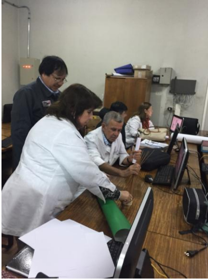
Taller de trabajo colaborativo