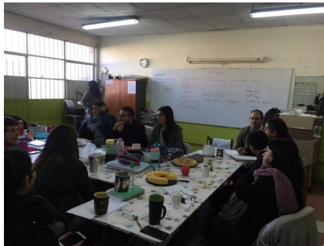
Taller de finalización de la intervención