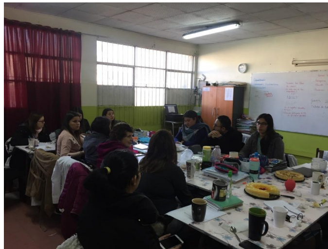
Taller de finalización de la intervención