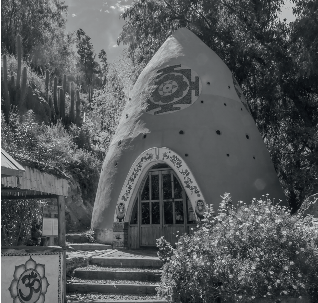
↑ Templo Alcohuaz místico donde se hacen sanaciones espirituales, ceremonias de purificación y guías de meditación.

pueblo, durante todo el año llegan turistas para vivir en carne propia todo lo que se dice de Vicuña: que es la primera ciudad del Valle del Elqui, uno de los mejores lugares para ver las estrellas, la capital del pisco chileno y la ciudad natal de la poetisa Gabriela Mistral. Además, la iglesia, la Torre Bauer, la Casa de la Cultura y el Museo Gabriela Mistral son los hitos urbanos que mejor reflejan la historia e identidad de Vicuña”. Otras zonas atractivas son Paihuano, Pisco Elqui y Cochihuaz, todos poblados cercanos a la cordillera de Los Andes, caracterizados por su misticismo.