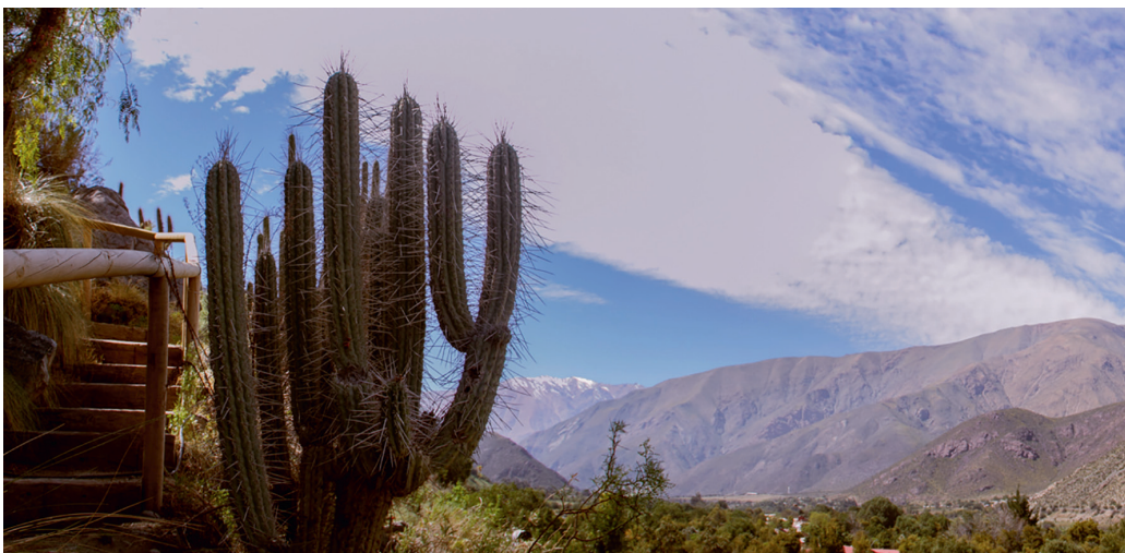
📍 Vistas panorámicas del Valle del Elqui