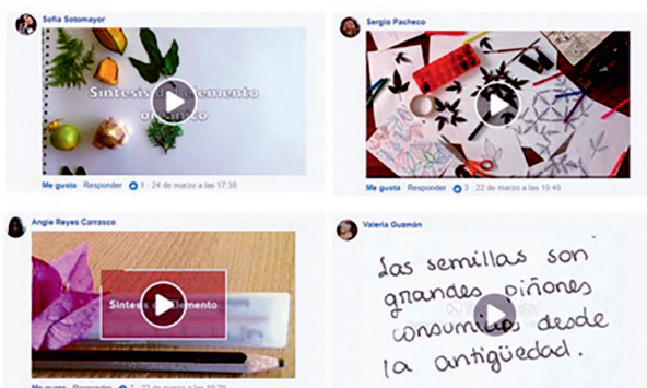
Desarrollo de videos y presentados como comentarios en la plataforma de red social Facebook