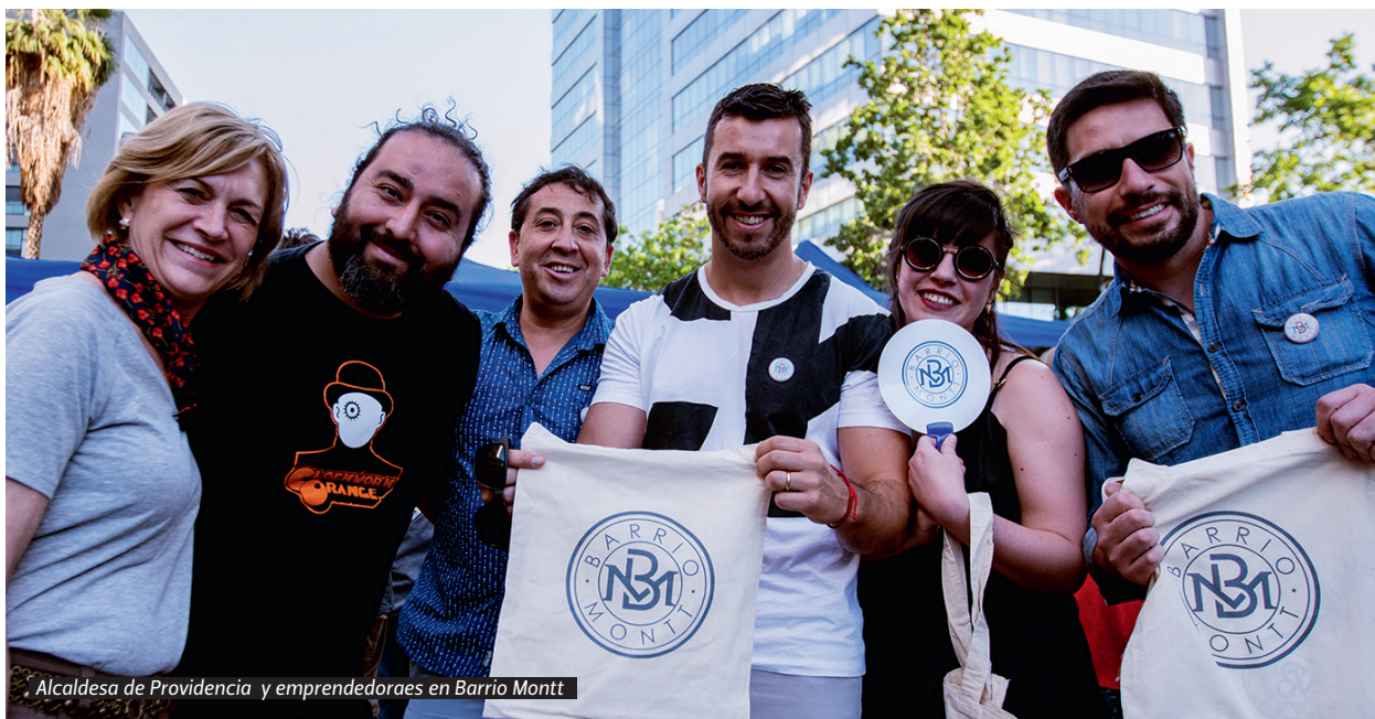
Alcaldesa de Providencia y emprendedoras en Barrio Montt