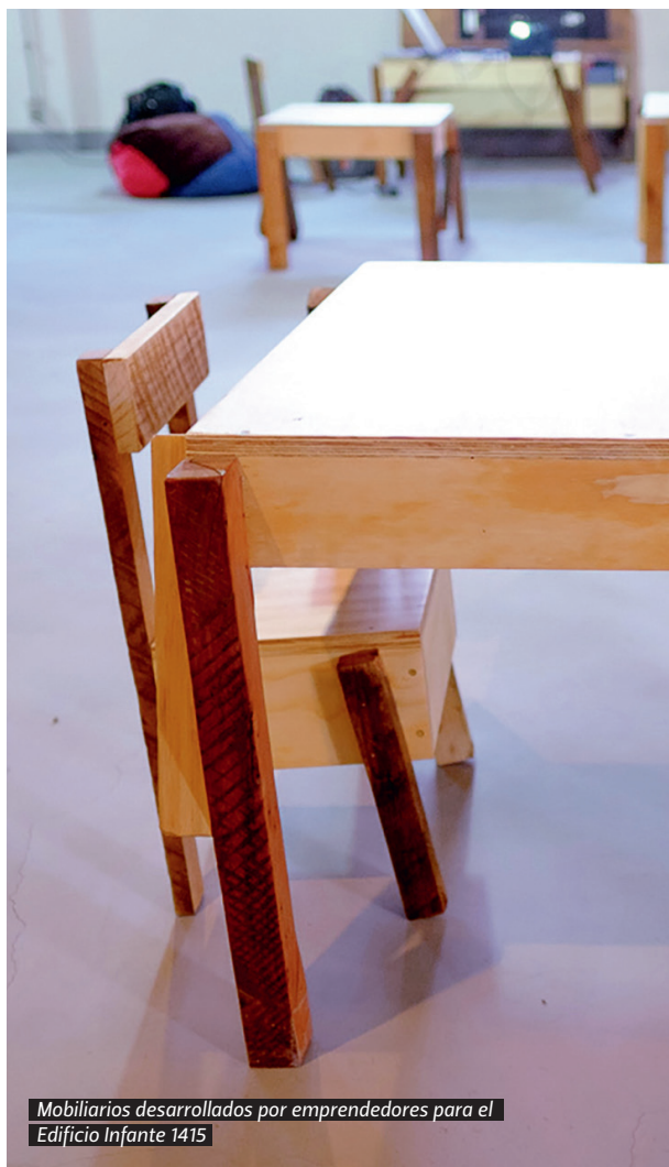
Mobiliarios desarrollados por emprendedores para el Edificio Infante 1415