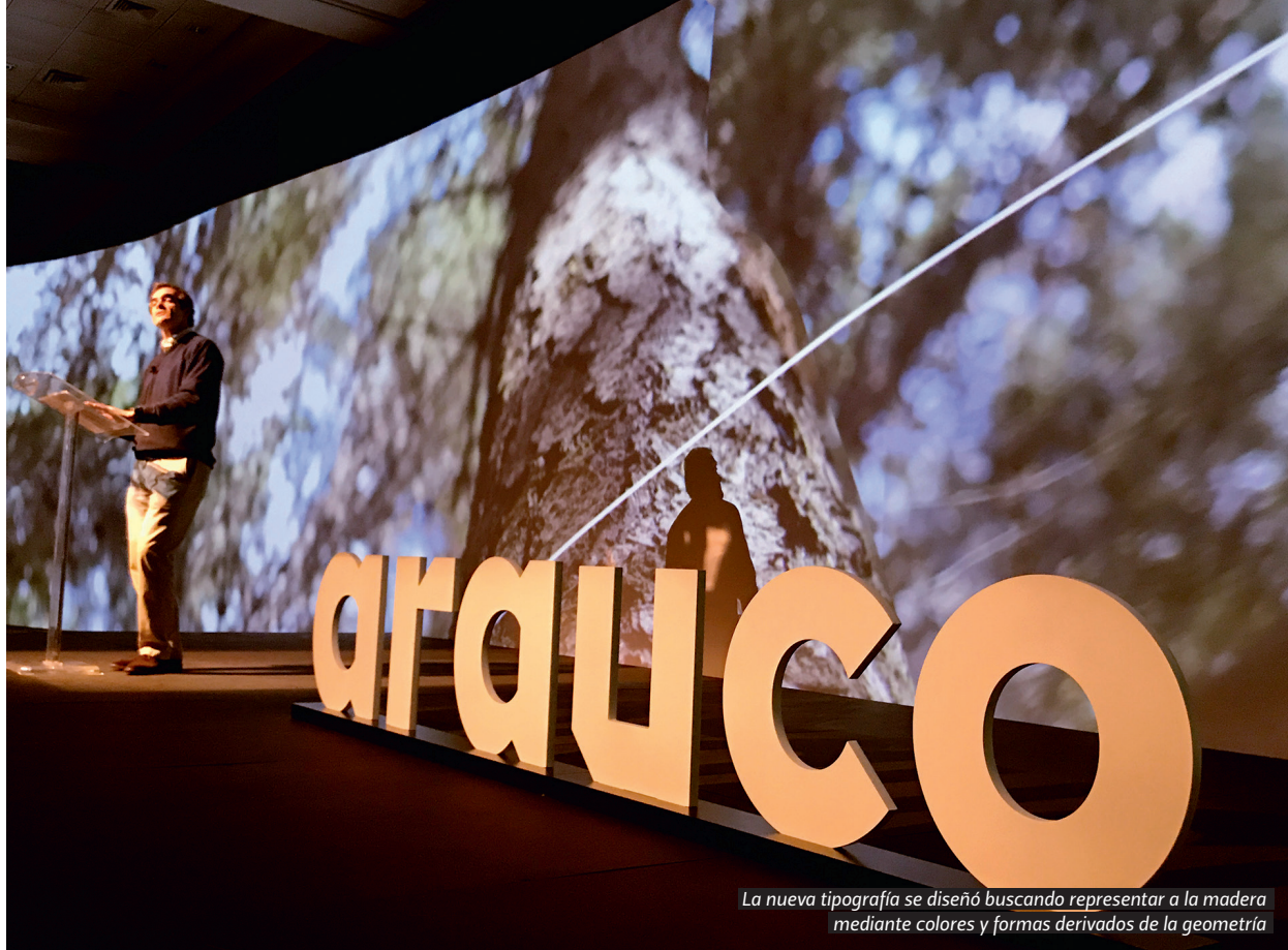
La nueva tipografía se diseñó buscando representar a la madera mediante colores y formas derivados de la geometría

empresa chilena fundada hace 50 años, hoy relevante en la industria forestal a escala mundial. Mucho de este crecimiento se explica por una capacidad de adaptación a escenarios competitivos cambiantes, al desarrollo de nuevos productos y a la búsqueda de nuevos negocios que proyecten su crecimiento futuro por vías sustentables.