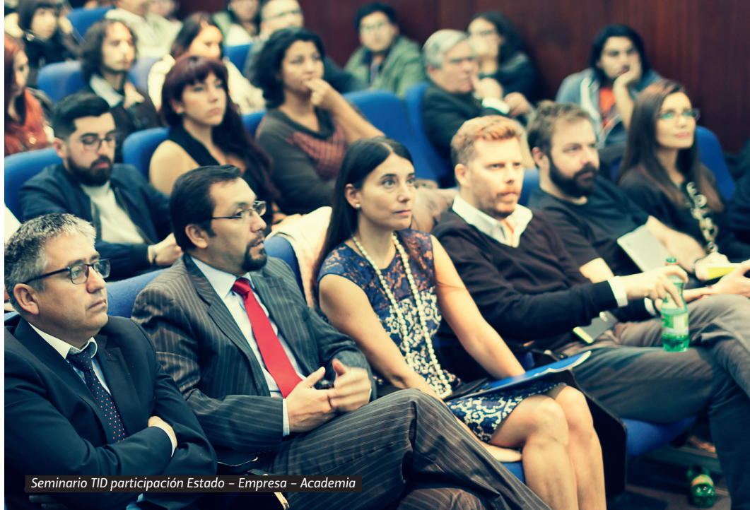
Seminario TID participación Estado - Empresa - Academia

siguiente paso es la innovación, tendencia predominante en economías desarrolladas.