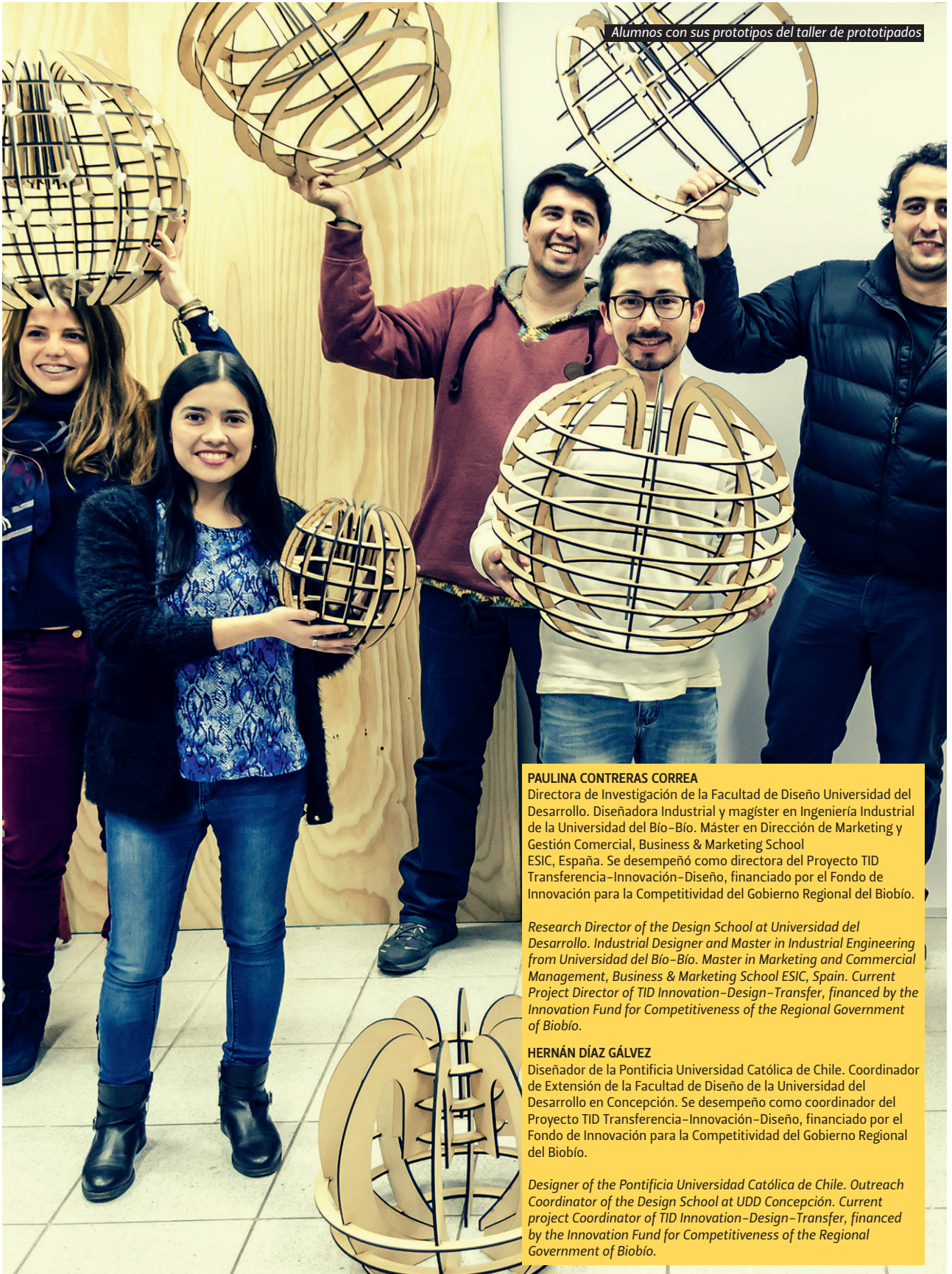
Alumnos con sus prototipos del taller de prototipados