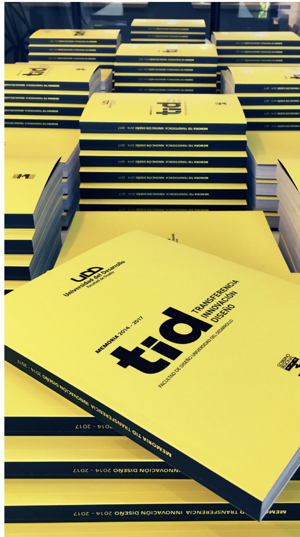
Publicación TID, realizada el 2017

Su objetivo principal es contribuir a la generación y difusión de conocimiento del diseño como herramienta estratégica aplicada, el cual permita validar su real aporte y así determinar las acciones estratégicas más pertinentes para implementarlo de manera efectiva en el ecosistema productivo regional a mediano y largo plazo.