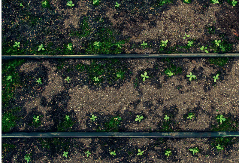
↑ Plantación de Orquídeas Bío Bío

desarrollo ganadero aporta un 10% de la producción nacional de carne. Además, posee un sector pesquero acuícola industrial que registra un total de 120 empresas exportadoras de productos del mar. En la zona, la actividad agroindustrial exportadora es creciente, así como la infraestructura para su procesamiento.