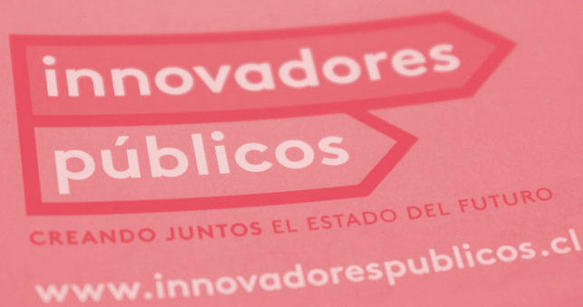
Material gráfico Innovadores Públicos