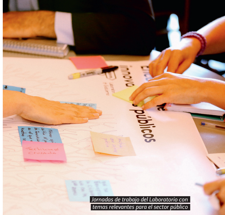
Jornadas de trabajo del Laboratorio con temas relevantes para el sector público

trabajan los funcionarios públicos en una etapa denominada “Proceso de exploración institucional”. Esa información es la que permite comprender cómo construir un proyecto para que llegue a puerto y para dejar instaladas en los usuarios las habilidades que lo harán funcionar.