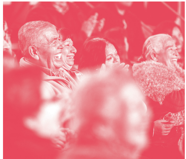
Asistentes al Encuentro Innovadores Públicos