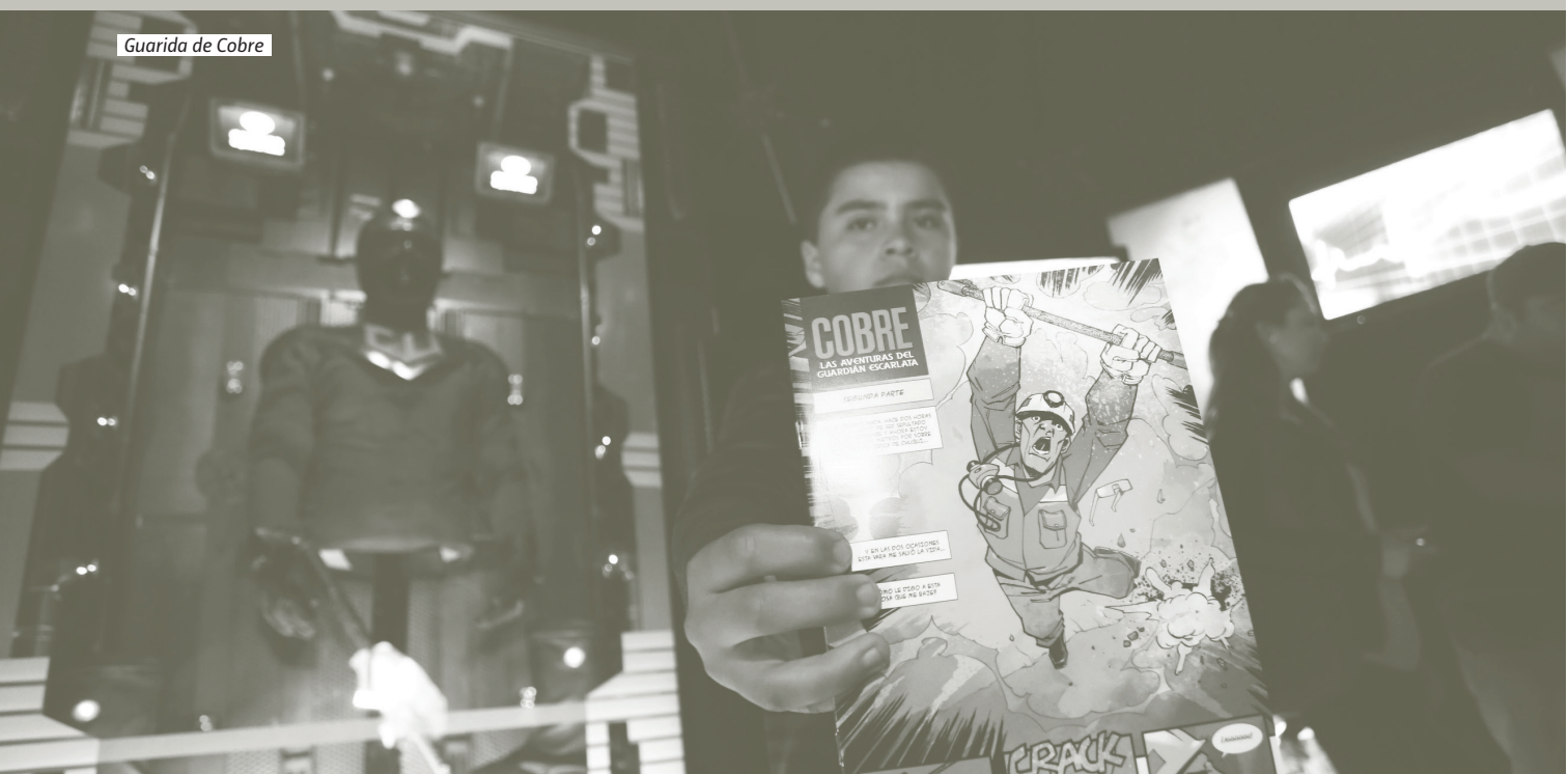
Guardia de Cobre

It is necessary and still pending to check the institutional innovation conditions in our country, creating the structures that would