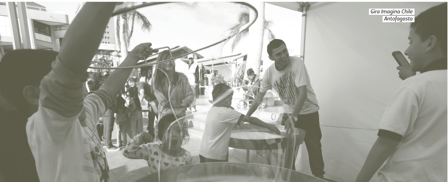
Gira Imagina Chile Antofagasta

Thus, “The Year of Innovation” was structured beginning with three main axis: in first place, science and technology , secondly, entrepreneurship and competition in order to give shape to the initiatives that were prompted in 2012, which was “The Year of Entrepreneurship”, and finally an axis that is related to quality of life . Around these three pillars, the programs were launched.