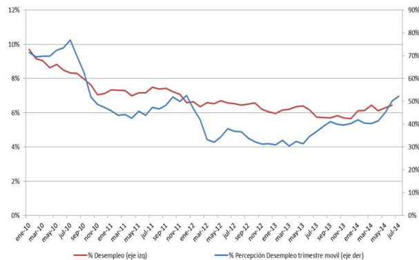
Gráfico 2 Desempleo y Percepción sobre Desempleo Actual

Nota: % Percepción desempleo para el próximo año: 100 - (%optimistas / (%optimistas + % pesimistas))