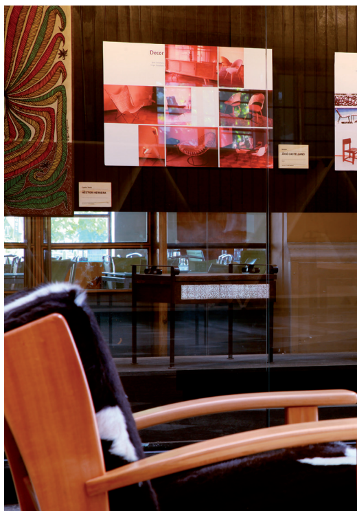
⬆ Muestra Retrospectiva, 40 años de diseño en Chile 1968 - 2005