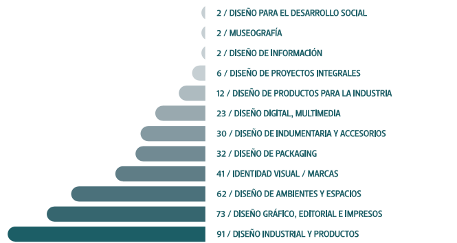
CANTIDAD DE PROYECTOS PROFESIONALES PRESENTADOS EN LA 4TA BIENAL SEGÚN ÁREA DE DESARROLLO DEL PAÍS