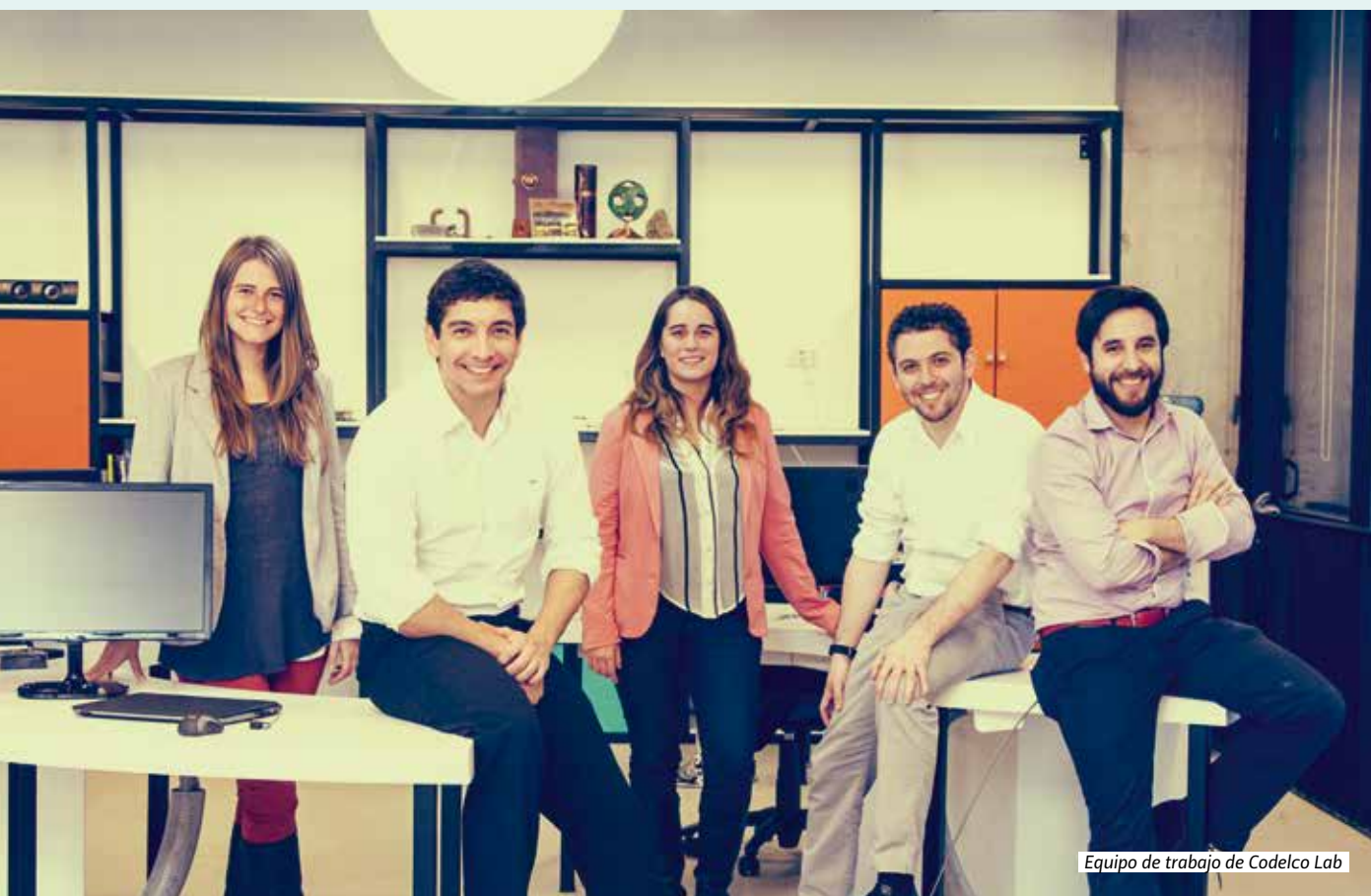
Equipo de trabajo de Codelco Lab

Aumentar la demanda de cobre, desarrollar nuevos usos para este metal y acercar sus beneficios a la mayor cantidad de gente, es el rol estratégico de Codelco Lab, filial de la cuprera estatal. Su objetivo es conectar, desde la experiencia práctica, la innovación y el emprendimiento con la minería.