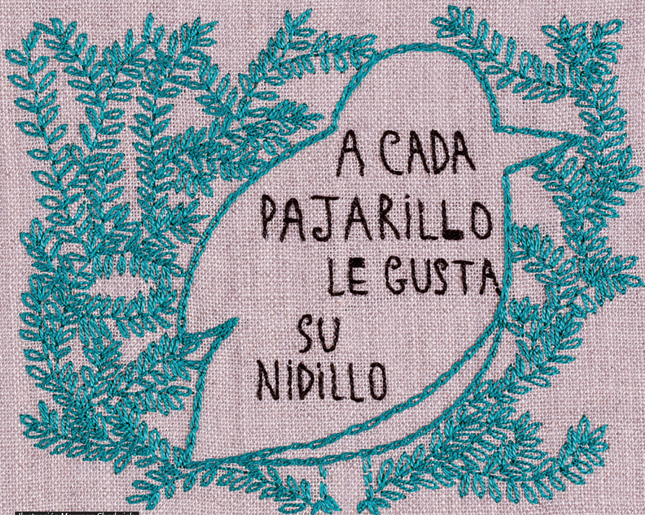
Ilustración Maureen Chadwick, "No des puntada sin hilo", Editorial Amanuta 2014